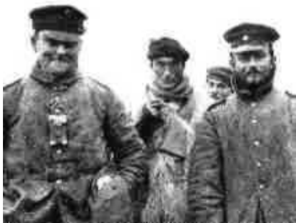
Outra foto registrando a “Trégua de Natal”.

A guerra havia começado novamente e a trégua não tinha esperança alguma de ser mantida. Mesmo entre as tropas que haviam travado um contato tão íntimo com o inimigo e onde, possivelmente, já não existisse tanto ódio contra ele, não houve nenhum esmorecimento no desejo de vencer. Bruce Bairnsfather, famoso cartunista da 1ª Guerra Mundial, uma das testemunhas oculares da “Trégua de Natal”, escreveria depois que, apesar do ocorrido, “nem por um momento o desejo de combater e de derrotar o inimigo relaxou. Isso foi apenas o intervalo entre “rounds” em uma amigável luta de boxe”.