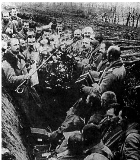
Soldados alemães cantam junto a uma árvore de Natal numa trincheira, Natal de 1914.

A 1ª Guerra Mundial é considerada, com muita propriedade, um dos banhos de sangue mais terríveis da História. Nomes como Verdun, Somme e Passchendaele nos remetem a imagens de incontáveis cadáveres espalhados pelo campo de batalha e cenários de indescritível destruição. Certamente, não poderia nunca haver mensagens de paz e de esperança em um ambiente como este. Mas, quem pensa assim, está redondamente enganado.