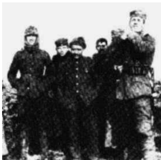
Fuzileiros de Dublin e alemães, na "terra-de-ninguém", Natal de 1914.

quiser conversar!". O alemão então subiu no parapeito da sua trincheira e se aproximou. Ambos trocaram saudações. Não havia nenhum oficial alemão, apenas soldados rasos. Eles conversaram em francês, pois um não sabia falar o idioma do outro. O alemão disse "Nós não precisamos matar vocês e vocês não precisam nos matar, então por que atirar?" Eles então trocaram tabaco alemão por geléia e tiraram a foto abaixo.