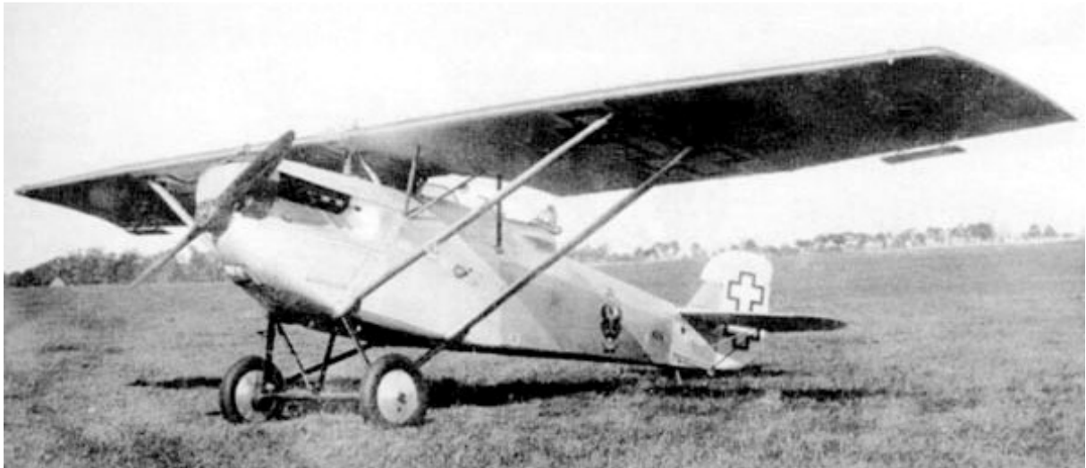
A.120 com marcações da Lituânia.

Era armado com 2 ou 3 metralhadoras de 7,7 mm. Comprimento - 8,60 m. Envergadura - 12,80 m. Altura - 2,80 m. Motor (1) - 550 HP. Peso (máx) - 1.420 kg. Velocidade - 254 km/h. Autonomia - ? Teto - 7.000 m. Tripulação - 2 homens.