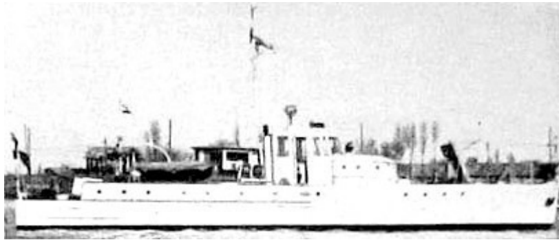
Barco da classe Azerbaijan, 1951.

Eram armados com 1 canhão de 47 mm. Deslocamento - 28 T (padrão). Comprimento - 20,90 m. Velocidade - 14 nós.